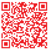
全通事務處理 全省徵求場所查詢

註：以上資料係屬彙總資料，股東如須查詢詳細資料請上證基會網站( https://free.sfi.org.tw/ )查詢。